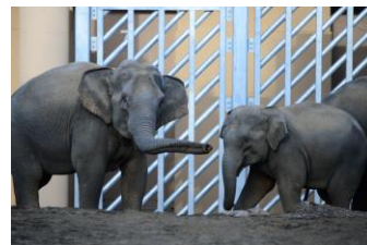
ミャンマー連邦共和国からきたメスのアジアゾウ シュティン（左）とニャイン（右）

去る2019年3月12日に、ミャンマー連邦共和国から来た4頭のアジアゾウを公開するゾウ舎がオープンしました。同動物園においては2007年以来のゾウ公開となり、ゾウの暮らしぶりやゾウを取り巻く環境問題への理解が深まる施設として連日にぎわいを見せています。